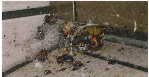
写真46. 窓枠 (左の写真拡大)