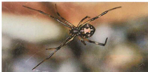
写真3. 腹部腹面に砂時計模様がある(雌)