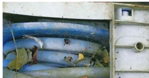
写真40. ホース巻き取り器 (左の写真拡大)