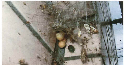
写真48. 窓枠の上方の右隅 (左の写真拡大)