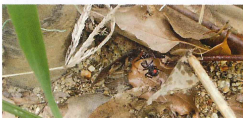
写真12. フェンス(左の写真拡大)