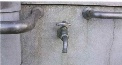
写真51. 校舎の外の水道蛇口 *夏休み期間中、使用しなかったため営業。