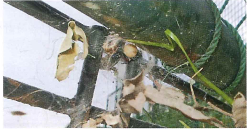
写真14. ネット (左の写真拡大)