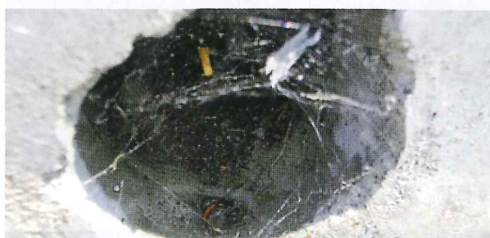
写真6. 市販のハエ・カ・ゴキブリ用エアゾール剤を吹き込むとセアカゴケグモが出てくる。(左の写真拡大)