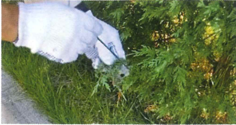
写真43. 病院の中庭の植木