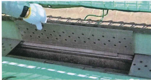
写真19. 使用前のプールの排水溝