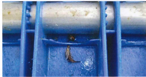
写真18. ベンチ (左の写真拡大)

*プラスチック製のベンチのくぼみは格好の住み場所になっている。横から見て巣がわかる場合もあるが、そうでないときもあるので、必ずひっくり返して調べる。