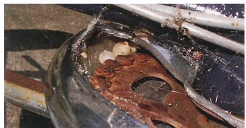
写真30. 駐輪場の自転車 カバー部分に卵囊。