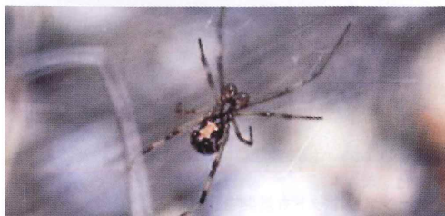
写真4. 腹部腹面に砂時計模様がある(雄)