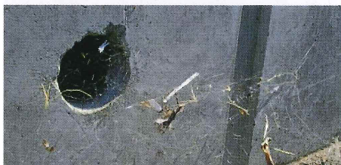
写真5. 駐車場の水抜き管に造られたセアカゴケグモの典型的な巣。糸の張りが強く、枯れ葉や紙屑等のゴミや餌となった昆虫等が付着している。