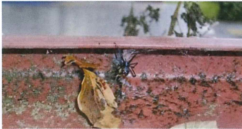
写真25. プランター *プランターの手入れや移動の際は注意が必要。