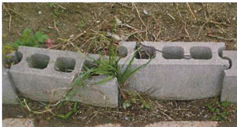
写真27. 花壇のブロック