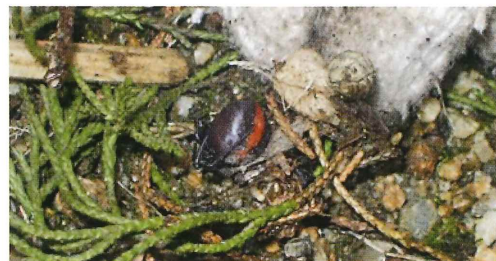
写真42. 幼稚園の庭の植木 (左の写真拡大)