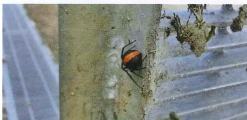
写真9. グレーチング