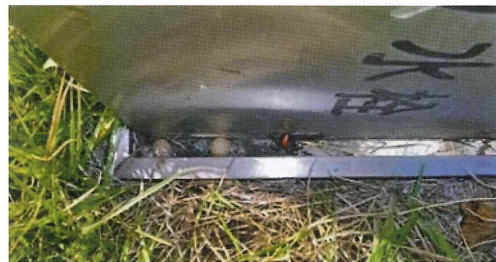
写真38. 散水栓 (左の写真拡大)