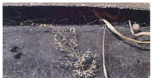
写真32. グラウンドに置いてあるタイヤ (左の写真拡大)