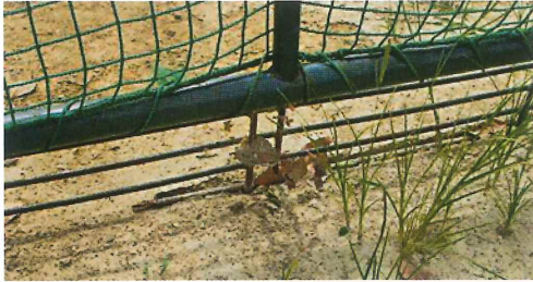
写真13. ネット *フェンスやネットも営巣場所としては格好の場所