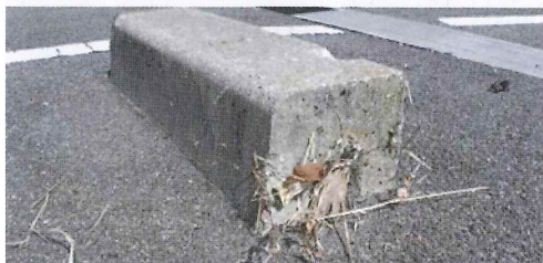
写真7. 駐車場車止めの窪みに巣