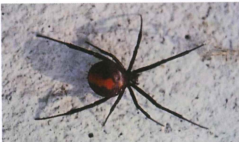
写真1. セアカゴケグモ雌 (体長約10mm) 背面は黒色に赤い帯状の模様