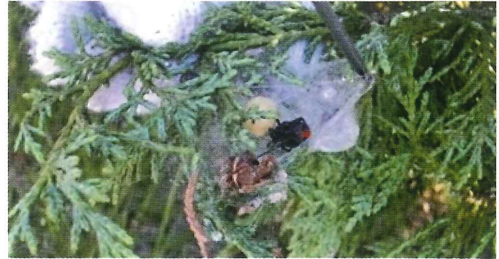
写真44. 病院の中庭の植木 (左の写真拡大)