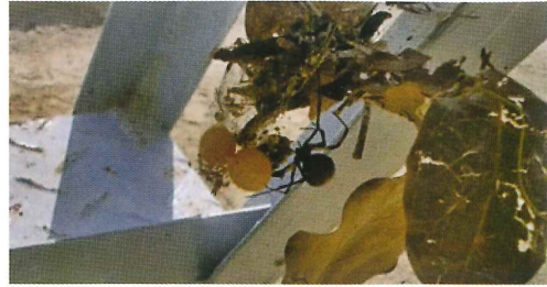
写真34. 朝礼台 (左の写真拡大)