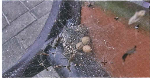
写真16. ベンチ (左の写真拡大)