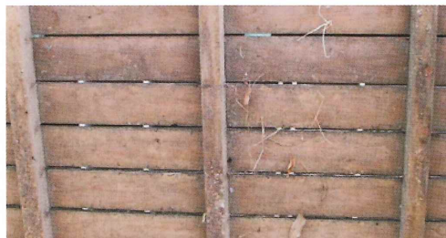
写真21. プール前の簀の子

*木製のみならず、プラスチック製の簀の子についてもセアカゴケモにとって良好な巣場所。