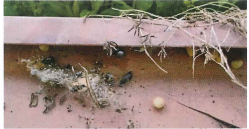
写真24. プランター (左の写真拡大) 持ち手部分にセアカゴケグモと卵囊。