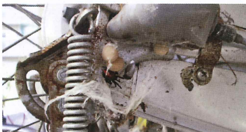
写真29. 駐輪場の自転車 セアカゴケグモと卵囊。