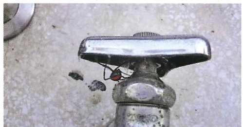
写真52. 校舎の外の水道蛇口 (左の写真拡大)