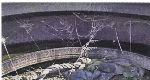
写真31. グラウンドに置いてあるタイヤ