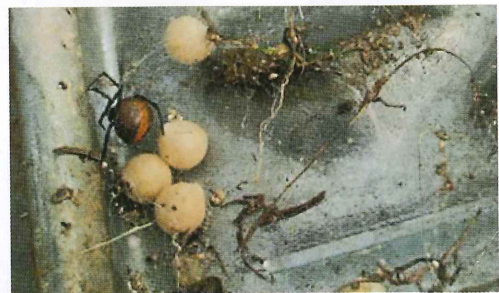
写真2. セアカゴケグモと卵囊 卵囊は黄白色、1つの卵囊中には100~200の卵