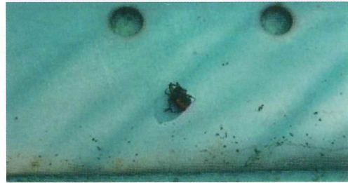
写真20. 使用前のプールの排水溝