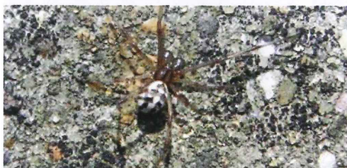
写真8. セアカゴケグモ雄(体長約3mm)発見。(左の写真拡大)