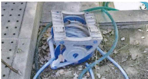
写真39. ホース巻き取り器