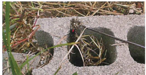
写真28. 花壇のブロック (左の写真拡大) ブロックの中にセアカゴケグモ。