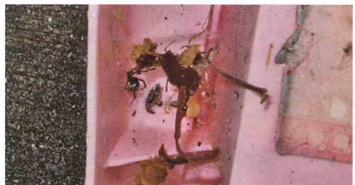
写真50. 遊具 (左の写真拡大)