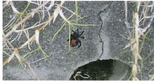
写真36. 水抜き管 (左の写真拡大)