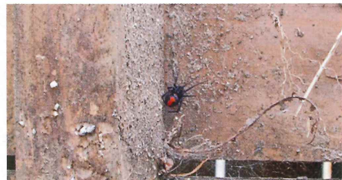
写真22. プール前の簀の子 (左の写真拡大)

*木製のみならず、プラスチック製の簀の子についてもセアカゴケモにとって良好な巣場所。