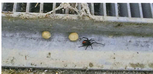
写真10. グレーチング